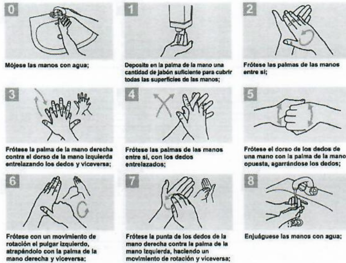
Gráfico limpieza de manos con alcohol en gel